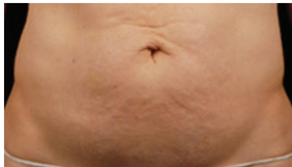
6 Mois après 1 séance de Thermage