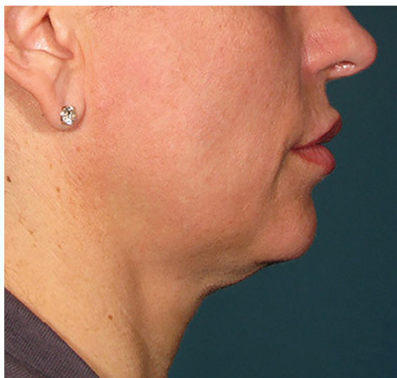
Avant le traitement