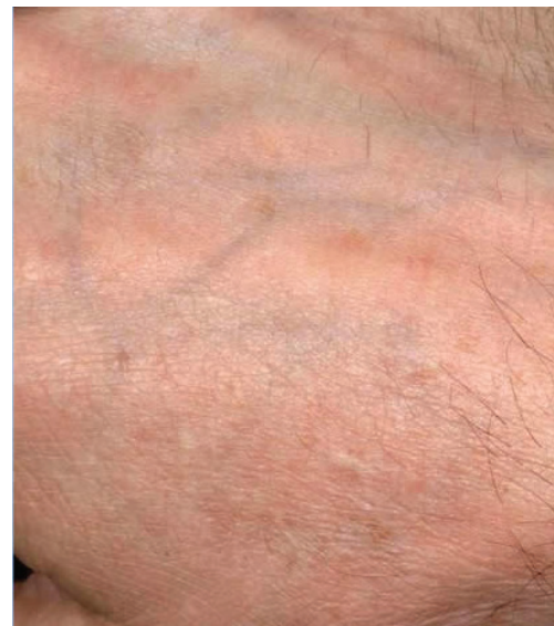
1 mois après le traitement laser