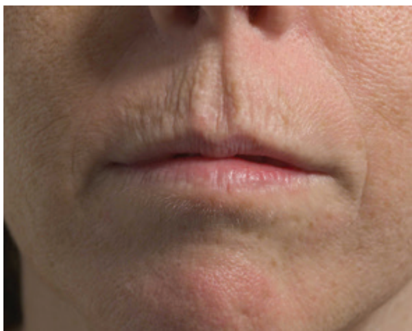
Avant le traitement