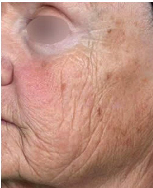
Avant le traitement