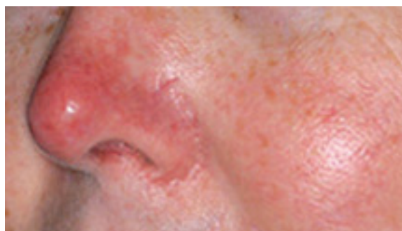
Erythrose du nez avant le traitement au laser à colorant pulsé