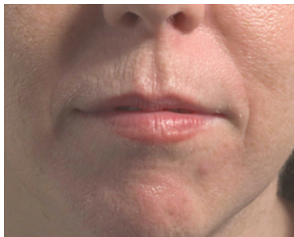
Après 1 seule séance de Fraxel Repair