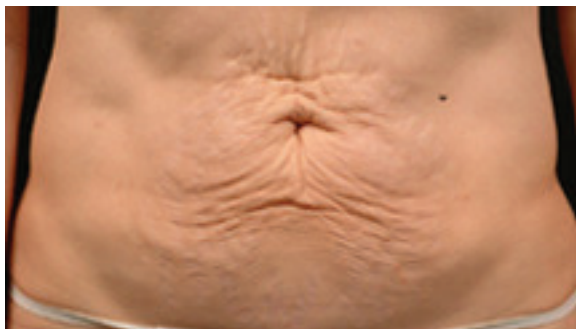
Avant le traitement