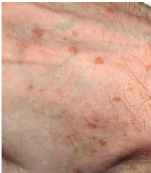
Avant le traitement