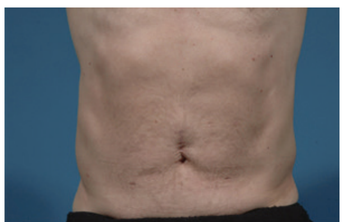
Avant le traitement