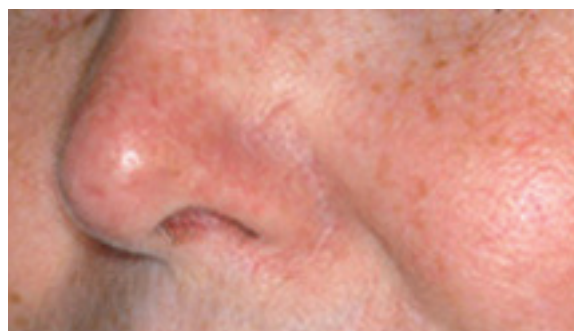
Après 2 séances de laser à colorant pulsé VBeam Perfecta