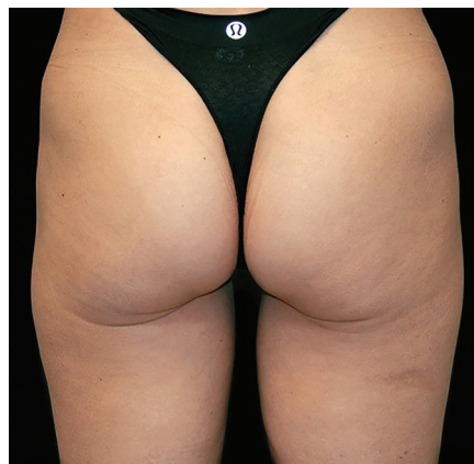
Après 5 séances