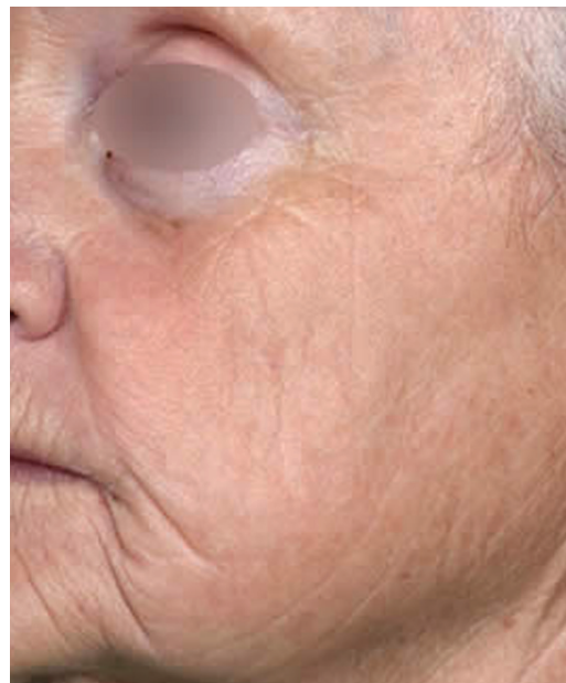
Après 4 séances de Fraxel Restore