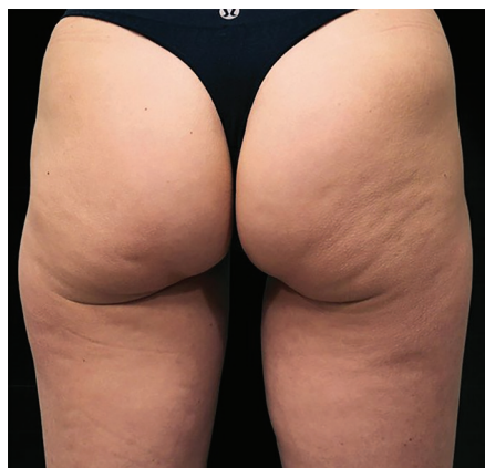
Avant le traitement